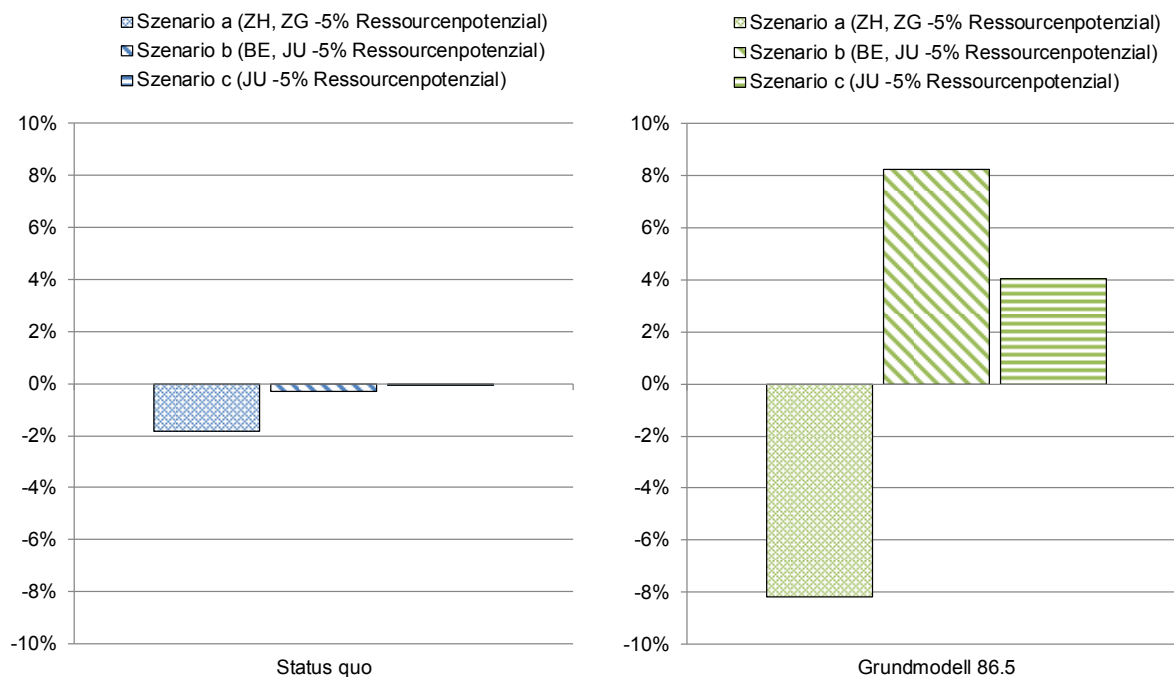
Abbildung 4: Stresstest - Veränderungen Gesamtdotation in % im Vergleich zur Situation gemäss Ressourcenpotenzial 2016